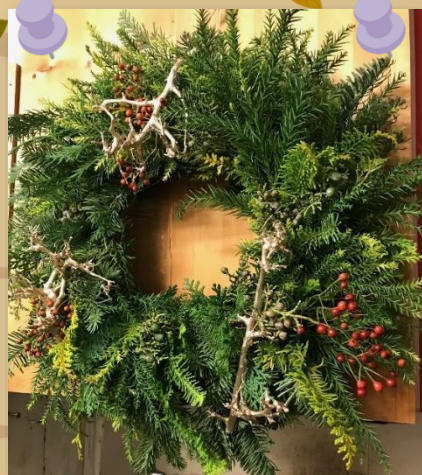
サイズ 直径 約 35 cm

日時 11月27日(日)10:00~12:00 会場 会館とどろき 体育室 参加費 1,000 円 税込 (別途 教材費 1,995 円 税込) 定員 20人 (最小実施人数 10人 11/20時点) 申込受付 11月1日(火)から。電話又は来館。先着順